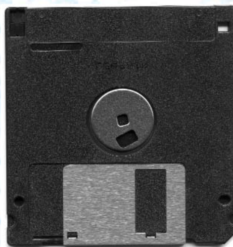
Disquette 3.5 pouces