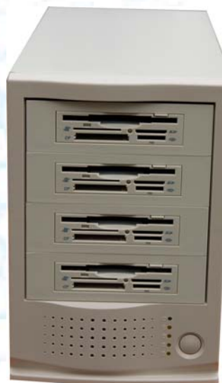
Le DupliflopMemory 4